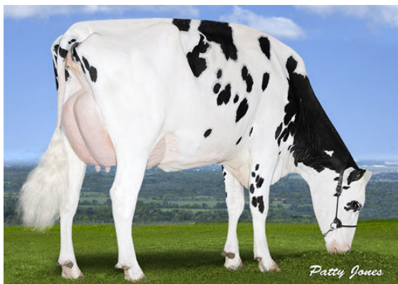
PEAK BOMBERO MAXIMA FOURTH DAM